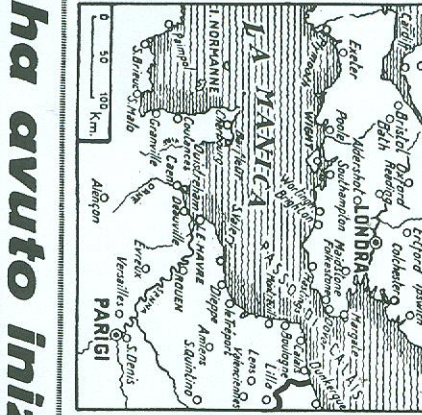
La battaglia di Cherbourg. I tedeschi hanno sbarcato in gran numero sulla costa della Senna e di Dunkerque. La difesa tedesca è dovunque in piena efficienza. Dopo sedici ore di combattimento, i tedeschi hanno investito il portuale militare germanico - al completo disarmato - a favore delle armi tedesche. Quasi tutto il personale, dell'entità di alcune divisioni, fra Le Havre e Cherbourg, sono state annientate. Gran parte delle truppe sbarcate dal mare sono state ricacciate in mare o annientate.